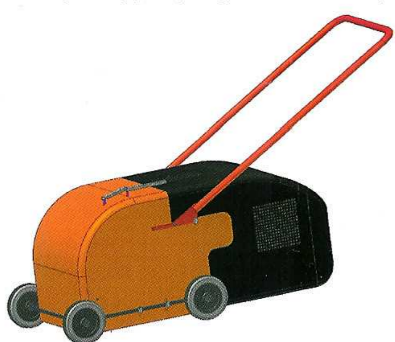
Model multifunkčního zahradního zařízení osazeného sběrným košem

Autorka pracuje na SPŠ strojírné v Košicích, spoluautor je studentem 4. ročníku této školy.